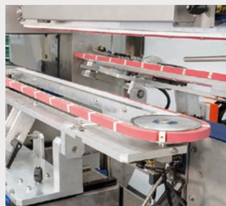
Stazione di uscita con cinghie guida regolabili a seconda dell'ampiezza del prodotto.