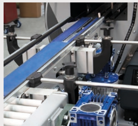
Nastro d'entrata progettato su misura del prodotto, collegabile alla linea precedente.