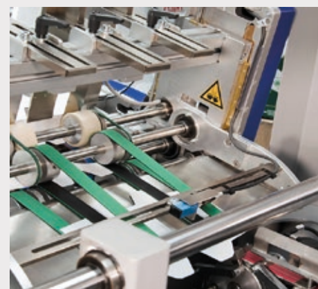
Magazzino fustelle con preciso meccanismo di rilascio, perfettamente sincronizzato con il prodotto in arrivo, equipaggiato di fotocellula esaurimento cartoni.