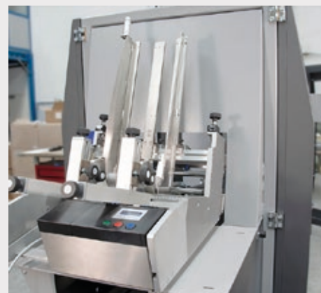
Ampio magazzino fustelle, standard fino a 1500 cartoni. Ampliabile su richiesta.