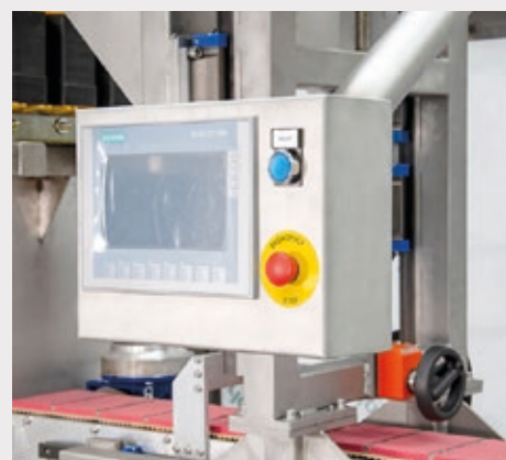
Touch screen SIEMENS od OMRON, intuitivo e user-friendly.