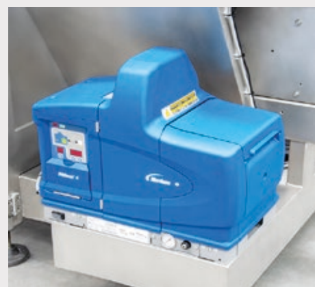
Fusore colla hot melt per la chiusura dei lembi inferiori Meler, Nordson o Noxon, su richiesta del cliente.