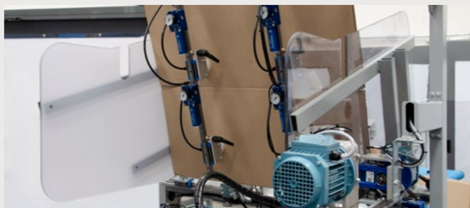
Apertura cartoni assicurata dal sistema ventose