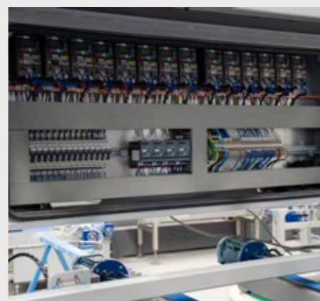
Quadro elettrico in posizione alta accessibile e visibile attraverso un lexan trasparente