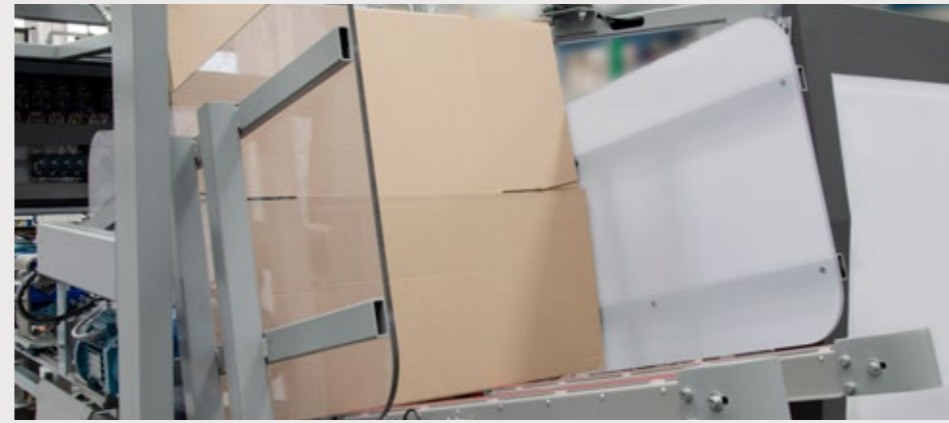
Le magasin de cartons peut être rempli, quand la machine est en fonctionnement. Sa position est ergonomique et accessible pour un vite changement de format