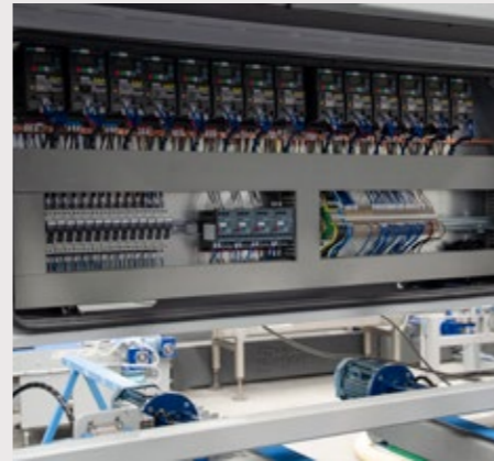
Tableau électrique en position haute accessible et visible à travers un lexan transparent