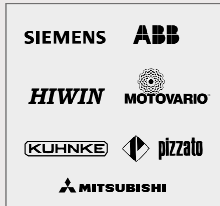
Composants de haute qualité, certifiés ISO.