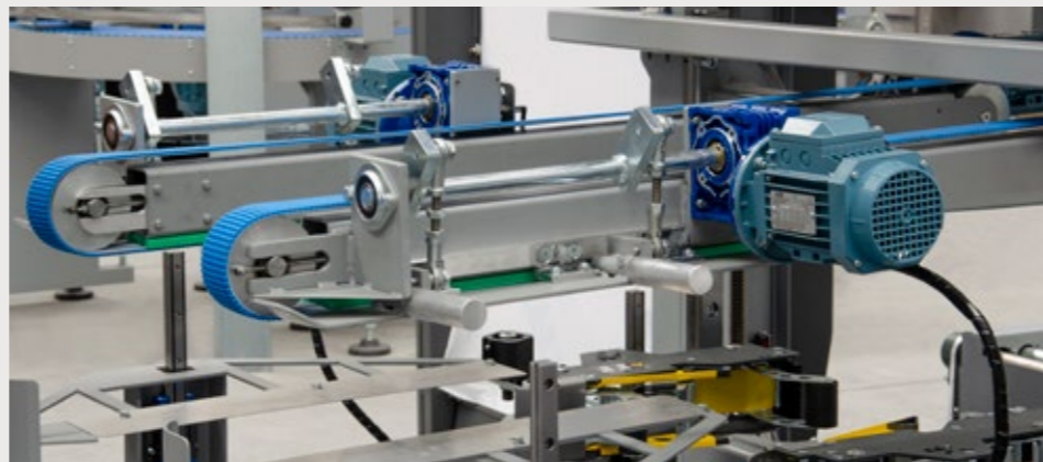
Les changements de formats sont vites grâce aux mouvements motorisés et précis grâce aux guidages linéaires

Encartonneuses pour tailles supérieures sur demande