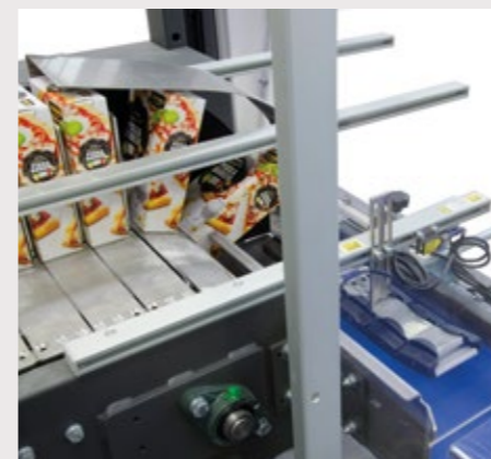
Bande d'alimentation réglable en fonction de la taille des produits et des configurations de groupage.