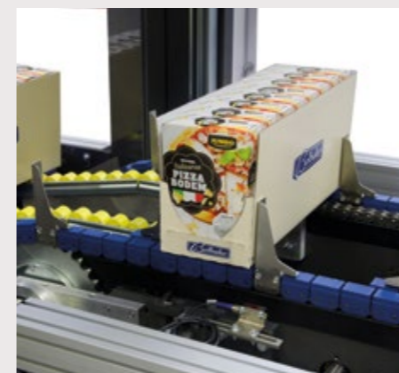
Machine très accessible pour diagnostic rapide. Entretien et nettoyage faciles.