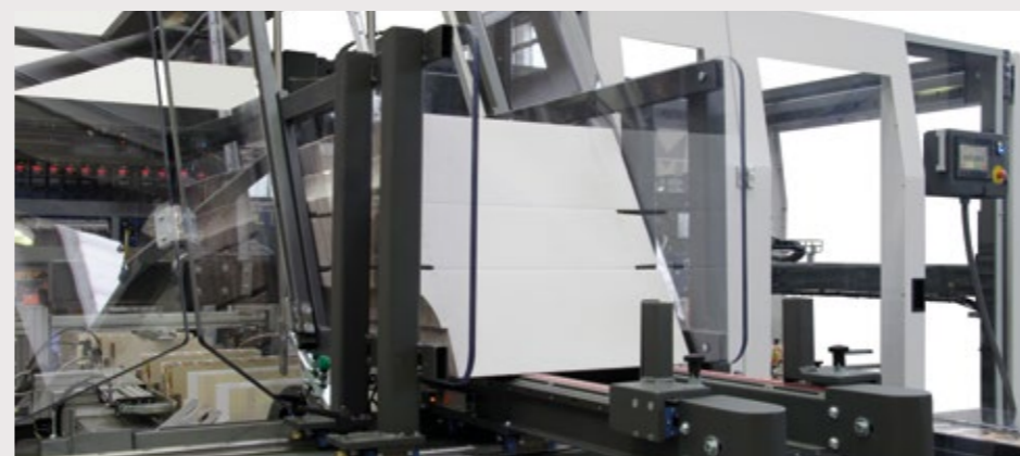
Vaste magasin de formes de découpes pour différentes tailles de cartons. Changement de format simple et rapide.