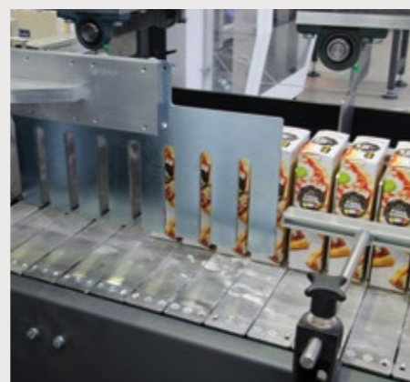
Système de poussée automatique pour le regroupement des produits en multipacks produits en multipacks.