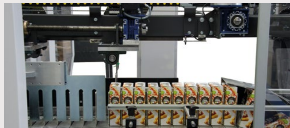
Machine compacte et ergonomique avec portes ouverture facile sur tous les côtés, très accessibles pour les opérateurs.