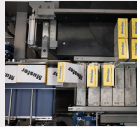
Systèmes de chargement et regroupement conçus à la dimension du produit à traiter.