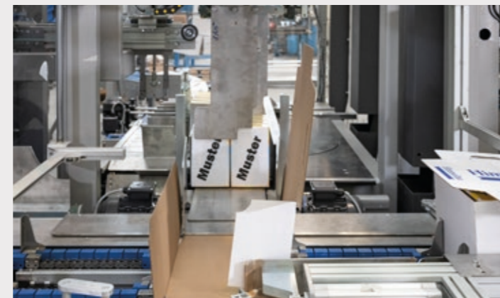
Système pick & place précis et soigné pour positionnement du multipack à l'intérieur du carton en cours de constitution.

D'autres tailles de carton peuvent être traitées sur demande.