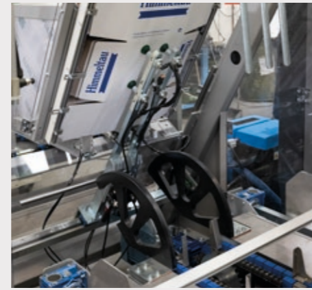
Prélèvement des cartons dans le vaste magasin avec un système à ventouses, sûr et fiable.