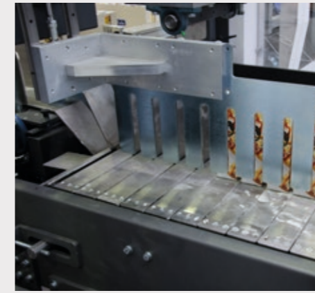
Le pousseur automatique permet de regrouper les produits et de les insérer avec précision dans le plateau/carton.