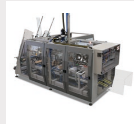
Machine compacte et ergonomique à ouverture facilitée sur tous les côtés, facilement accessible à l'opérateur.