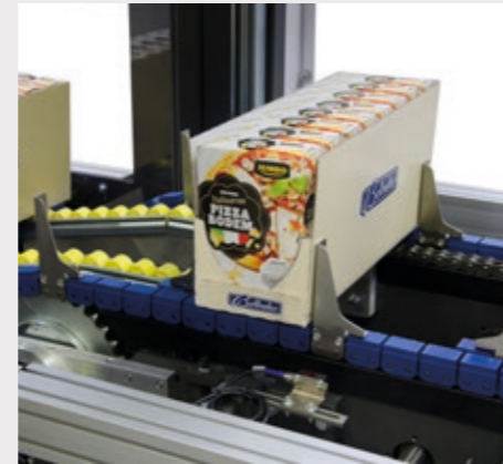
Sortie du carton sûre et stable grâce aux convoyeurs conçus à la dimension du produit.