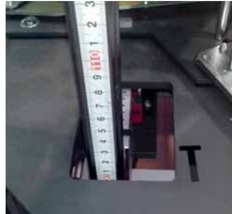
Verstellen und Einstellungen auf Profilschielenführungen.