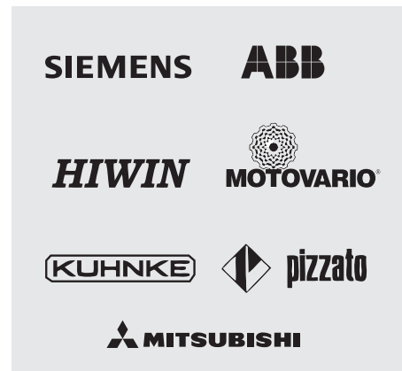
Premiumkomponenten mit ISO-Zertifizierung.