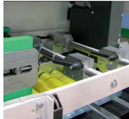
Einlauftransportband mit verschiedenen Beschickungssystemen (produktabhängig).