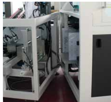
Separates Beschickungssystem für einen besseren Zugang und mehr Bedienerfreundlichkeit.