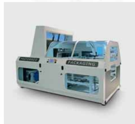
Kompakt & flexibel.