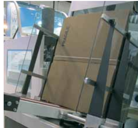
Bereich zum Kartonfalten mit Aufbewahrung.