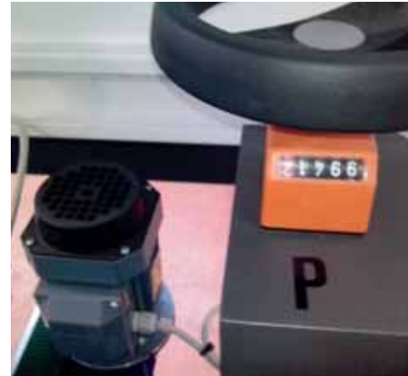
Motorbetriebene automatische Einstellung.